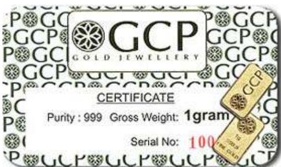
Gold Bar GCP 1g

Gold Bar GCP 1g adalah antara produk GCP yang terlaris.