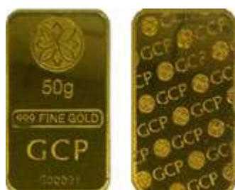
Gold Bar GCP 50g