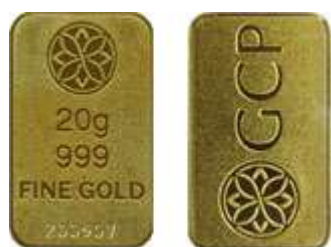
Gold Bar GCP 20g