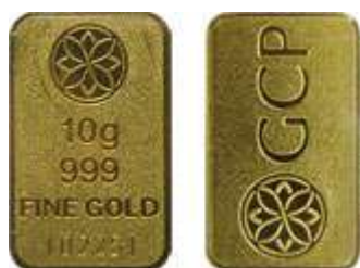
Gold Bar GCP 10g