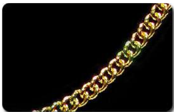
Rantai Leher Gajah