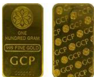
Gold Bar GCP 100g