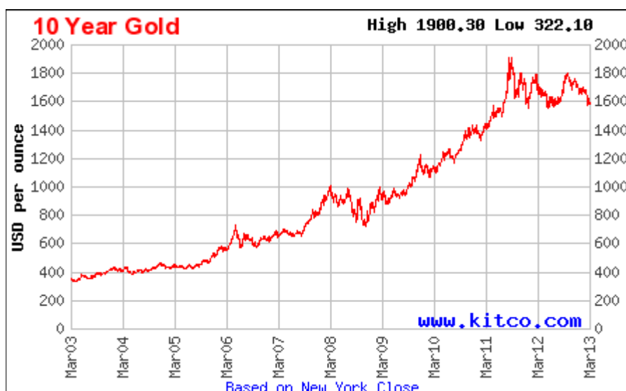
Graf emas dunia dalam jangkamasa 10 tahun.

Peningkatan harga emas dari tahun ke tahun adalah salah satu sebab, mengapa anda perlu menyimpan emas. Contohnya, harga emas telah meningkat daripada RM30/gram sekitar tahun 2000 kepada RM180/gram pada tahun 2012. Trend tersebut menjadikan menyimpan emas dalam jangka masa panjang adalah satu langkah aktiviti pelaburan yang amat selamat. Rekod dan graf harga emas semasa dunia boleh di semak di website www.kitco.com .