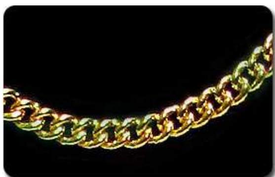
Rantai Leher Gajah