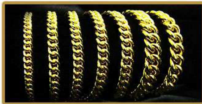
Rantai Tangan Gajah