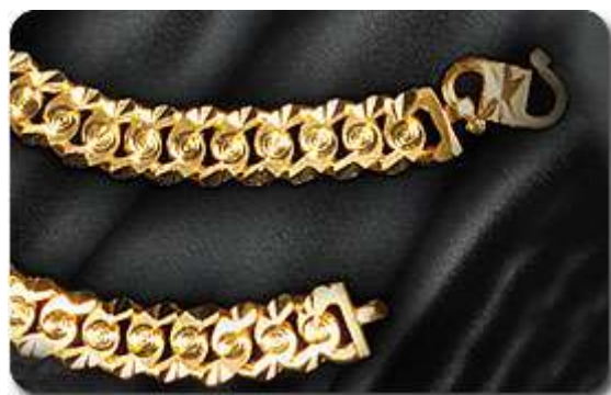
Rantai Tangan Melur