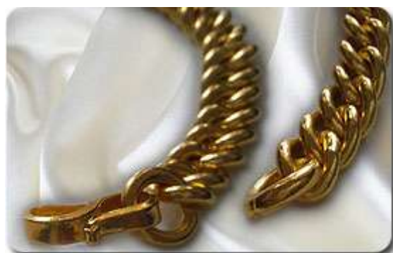
Rantai Tangan Gajah