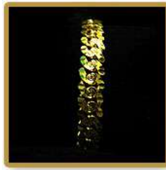
Rantai Tangan Melur