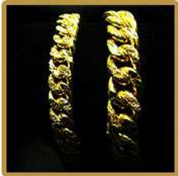
Rantai Tangan Bunga Pasir