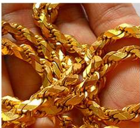
Rantai Leher Pintal