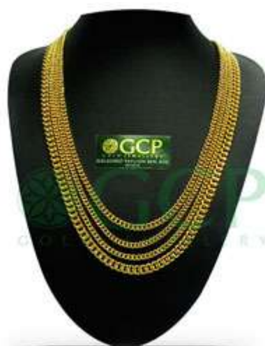
Rantai Leher Gajah