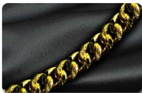
Rantai Tangan Bunga Pasir