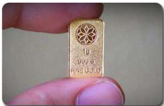
Gold Bar GCP 1g