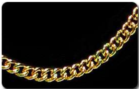
Rantai Leher Gajah