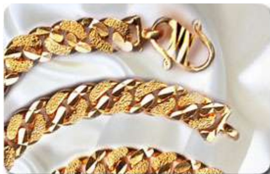
Rantai Tangan Pasir