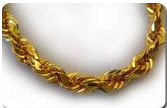
Rantai Leher Pintal