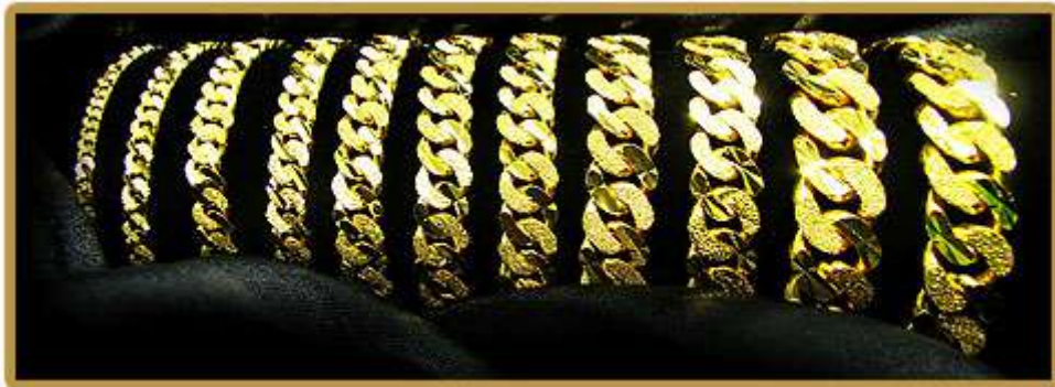
Rantai Tangan Pasir