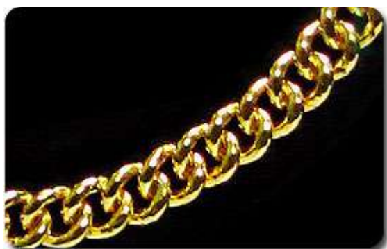
Rantai Leher Gajah